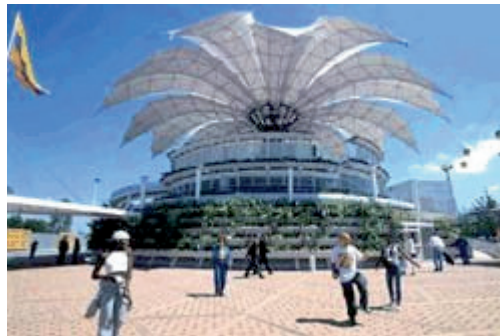
Abb. 1: Venezolanischer EXPO-Pavillon