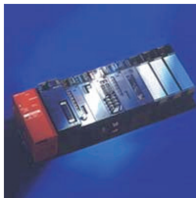
Abb. 2: MELSEC AnS

Diese Lösung garantiert bei dieser anspruchsvollen Anwendung eine optimale Programmsicherheit. Außerdem steht dem Betreiber mit 1024 Ein-/Ausgängen und der Verarbeitungsgeschwindigkeit von 1,0 ms, integriertem RAM-Speicher und Echtzeituhr sowie trigonometrischen Funktionen ein umfangreiches Leistungspaket zur Verfügung.